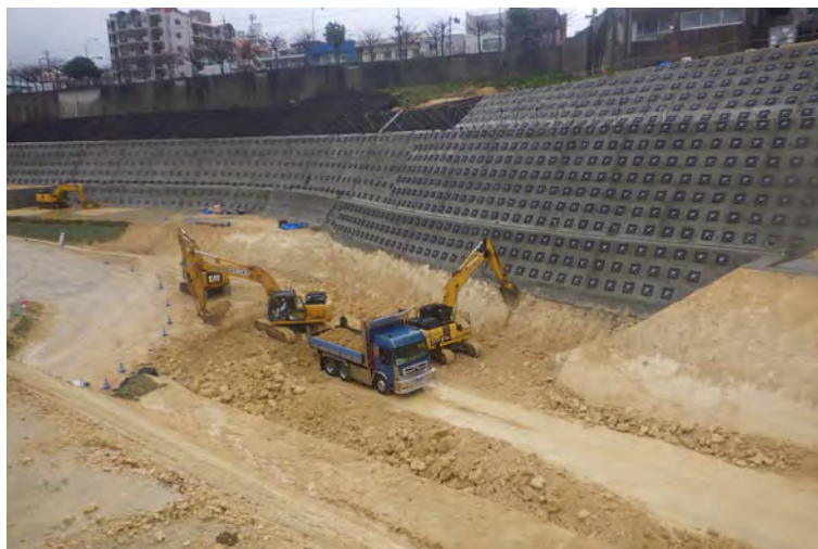
写真⑤（土工 残土搬出及び1段目法面整形）