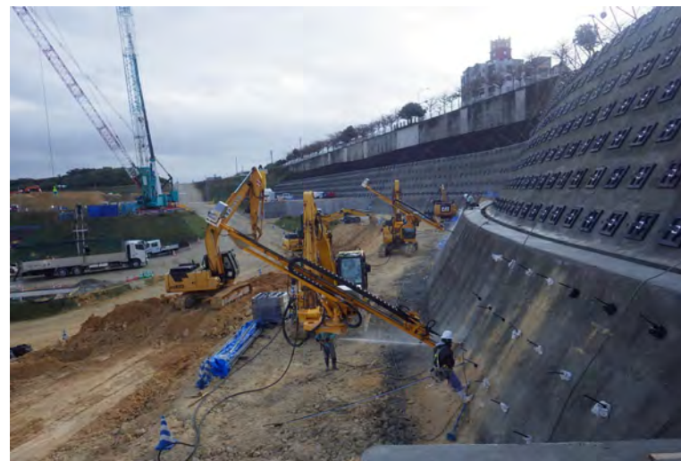
写真⑥（法面保護工1段目 クローラ2台施工状況）