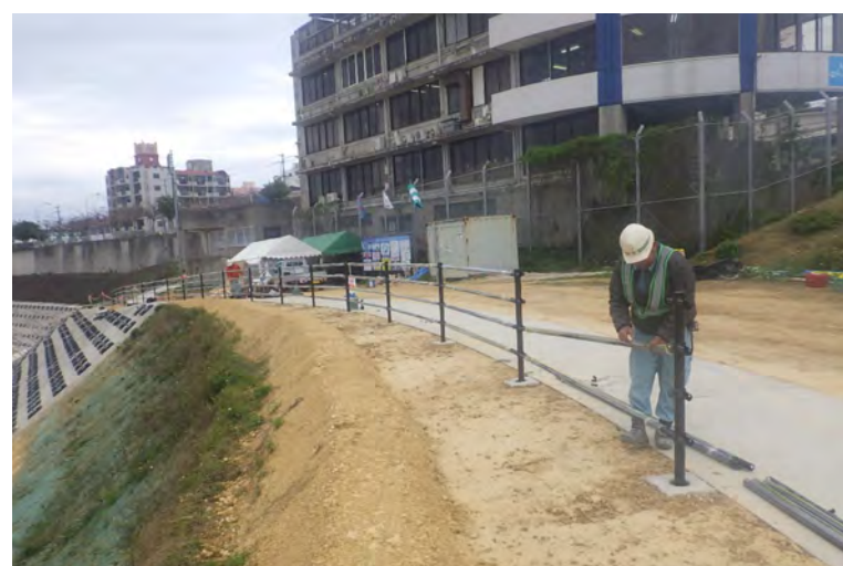
写真⑧（管理道 転落防止柵設置状況）