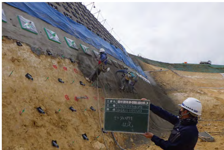
写真⑦（法面保護工1段目 土留吹付状況）