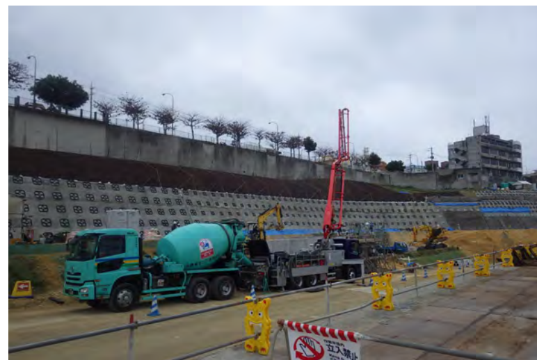
写真⑧ (現場打ちL型2号 擁壁コンクリート打設状況)