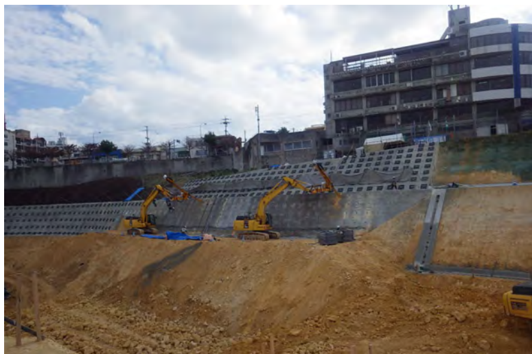
写真⑤ (法面保護工 ロックナット削孔2台施工)