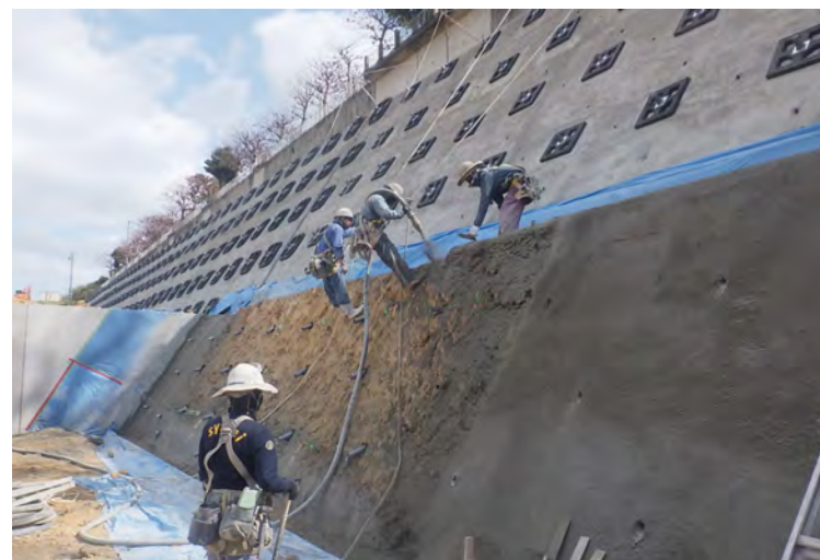
写真⑥ (法面保護工1段目 マテリアル吹付状況)