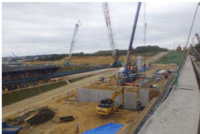
写真⑦ (プレキャストL型2号 擁壁設置)