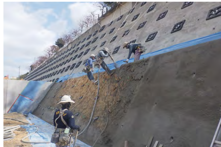
写真⑥ (法面保護工 1段目 塵外吹付状況)