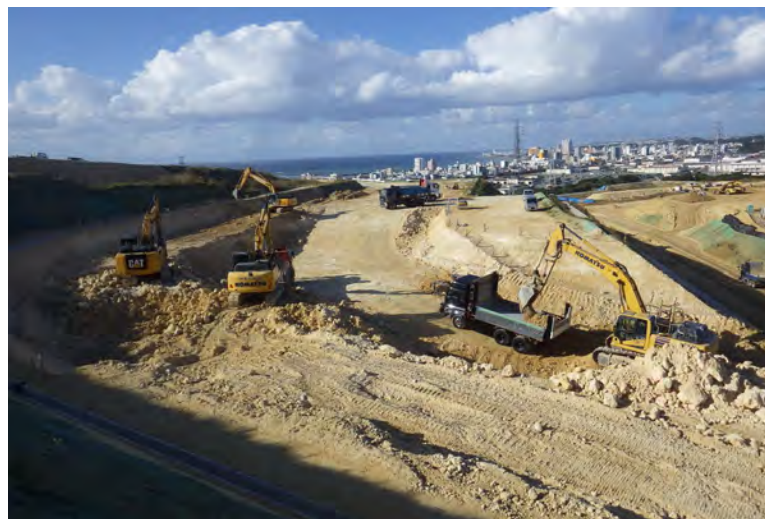
写真⑤ (土工 掘削・積込み・搬出状況)