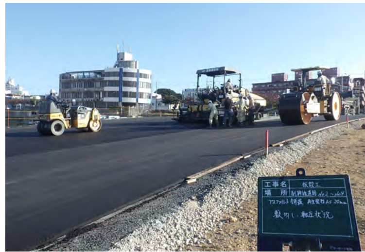
写真⑧ (副幹線道路 仮舗装状況)