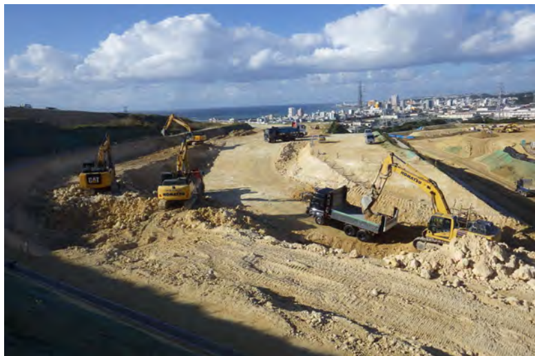
写真⑤ (土工 掘削・積込み・搬出状況)