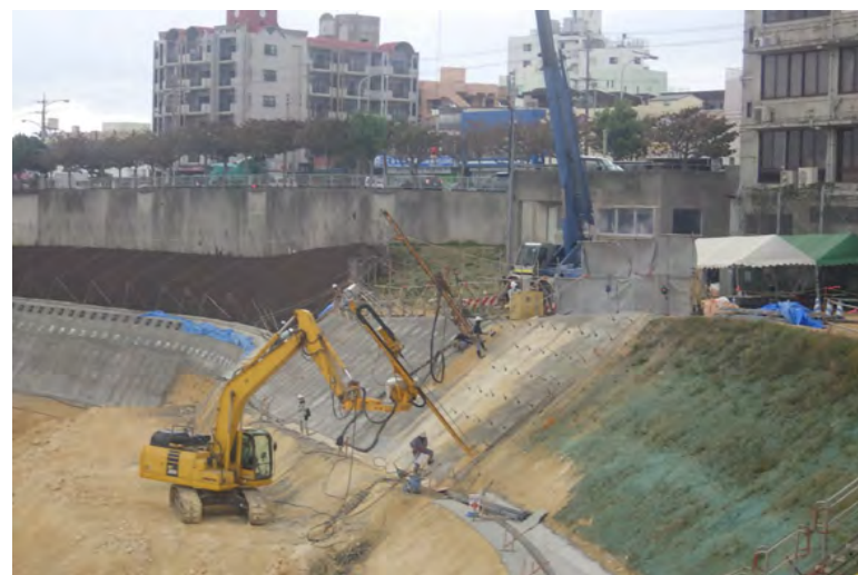
写真⑥ (法面保護工 ロックバルト削孔2台施工)