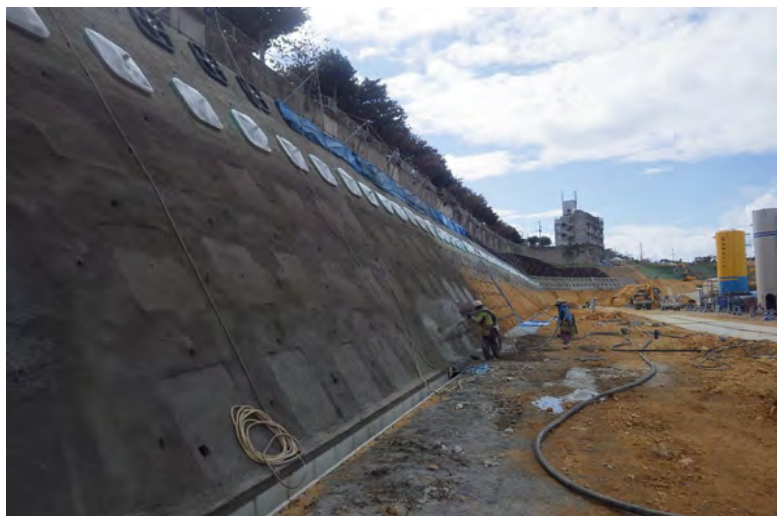
写真⑦ (法面保護工 2段目2回目 珪砂吹付状況)