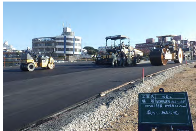
写真⑧ (副幹線道路 仮舗装状況)