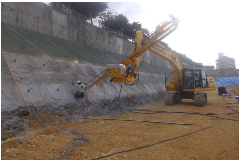
写真⑦ (法面保護工 2段目 叩砕・削孔状況)