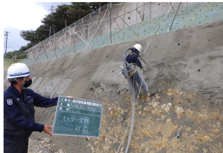
写真⑥ (法面保護工2段目 吹付状況)