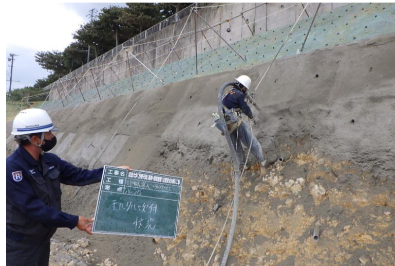
写真⑥ (法面保護工 2段目 珪砂吹付状況)