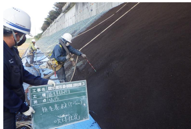
写真⑧ (法面保護工3段目 植生基材吹付状況)