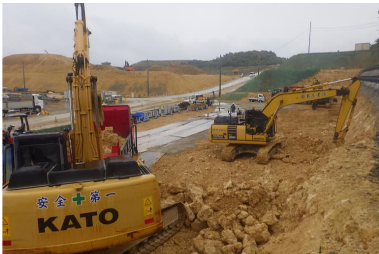
写真⑤ (土工 掘削積込み状況)