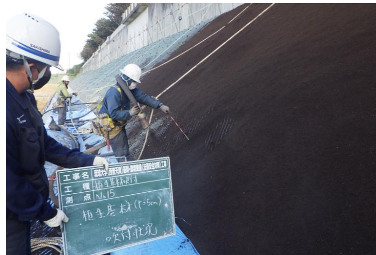
写真⑧ (法面保護工 3段目 植生基材吹付状況)