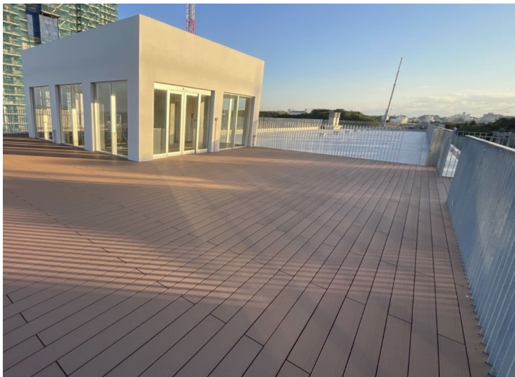
写真⑦ (エネルギーセンター 屋上デッキ)