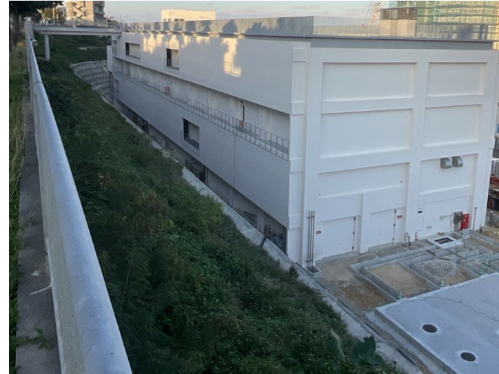
写真⑥ (南東側 エネルギーセンター)