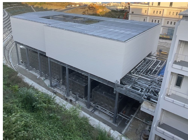
写真④（南側 設備建屋）