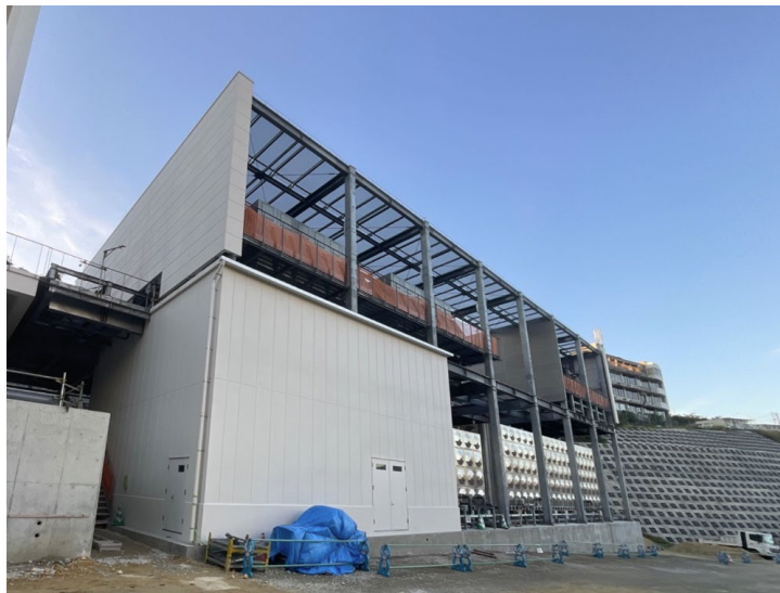
写真①（北東側 設備建屋）