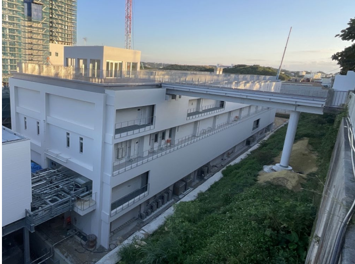
写真⑤ (南側 エネルギーセンター)