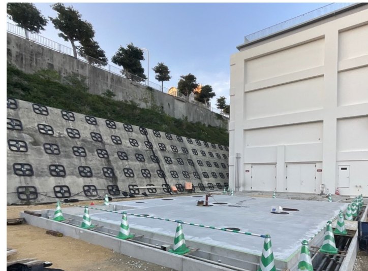
写真⑧ (エネルギーセンター オイルタンク)