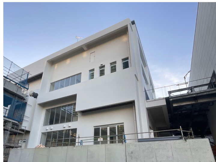
写真②（北東側 エネルギーセンター）