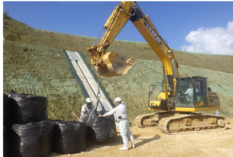
写真⑧ (仮設工 耐久性大型土のう設置状況)