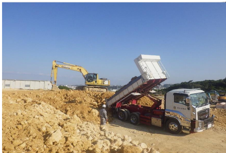
写真⑤ (土工 残土運搬状況)