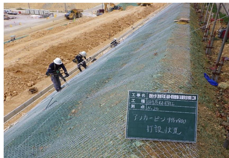
写真⑥ (法面保護工3段目 アンカーピン打設状況)