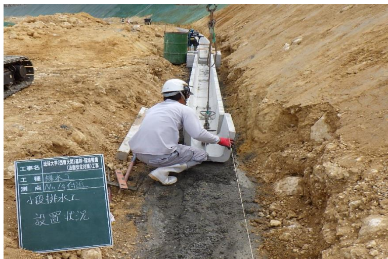
写真⑦ (小段排水工 側溝設置状況)