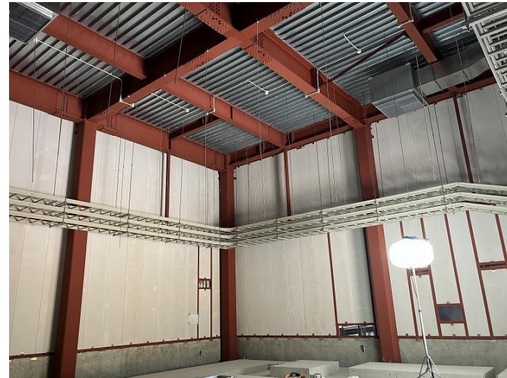
写真⑧ (設備建屋ポンプ室 ケーブルラック設置状況)