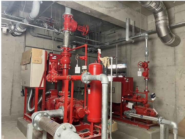
写真⑦ (エネルギーセンター消火ポンプ設置状況)