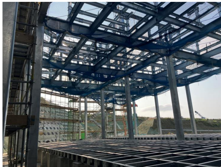
写真⑧ (設備建屋鉄骨躯体)