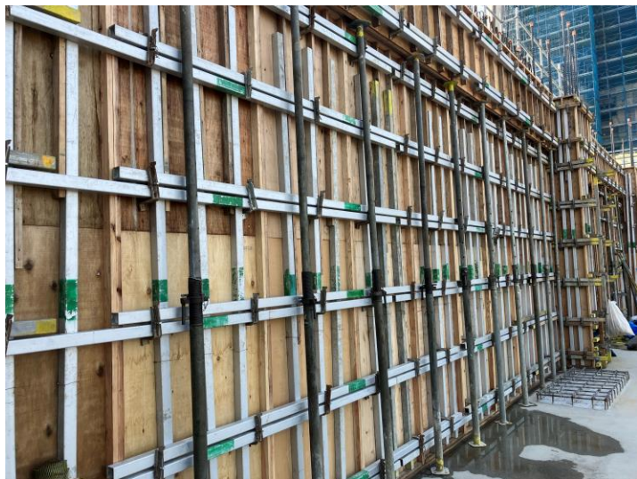
写真⑦ (エネルギーセンター3階躯体)