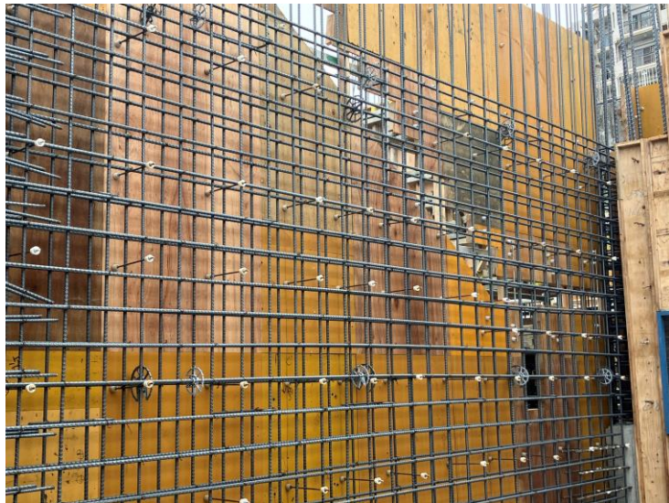
写真⑦ (エネルギーセンター2階躯体)