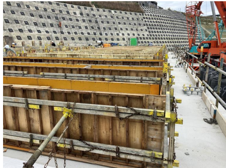
写真⑧ (設備建屋受水槽基礎)