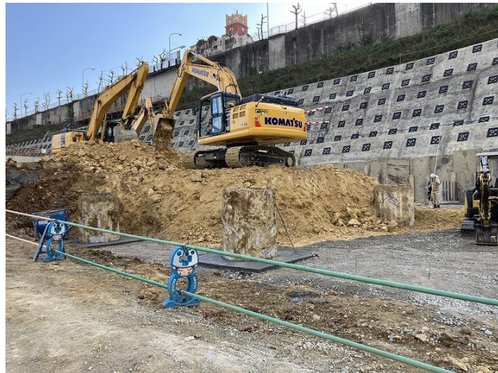
写真⑧（設備建屋根切り工事）