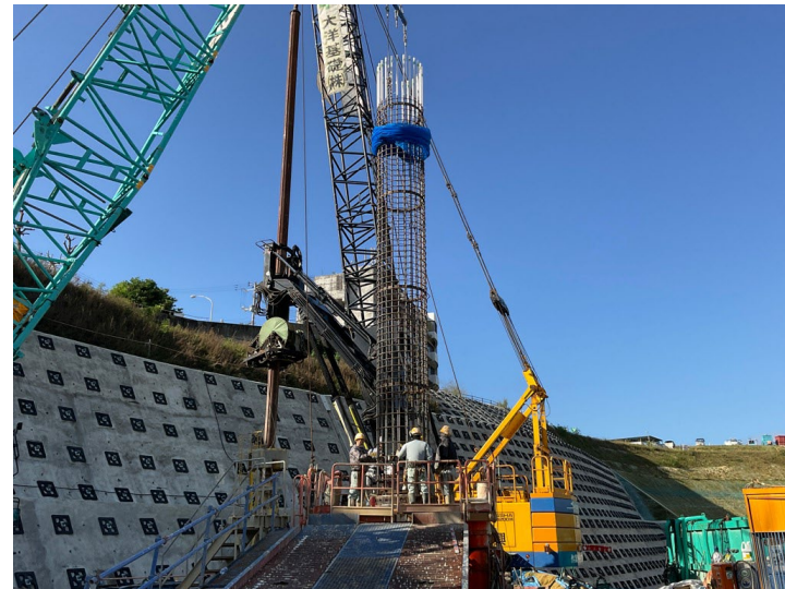
写真⑧（設備建屋杭工事状況）