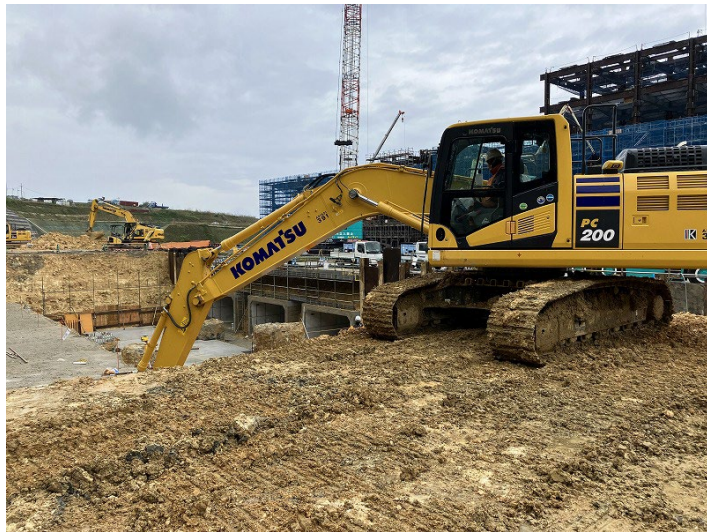
写真⑦（エネルギーセンター土工事状況）