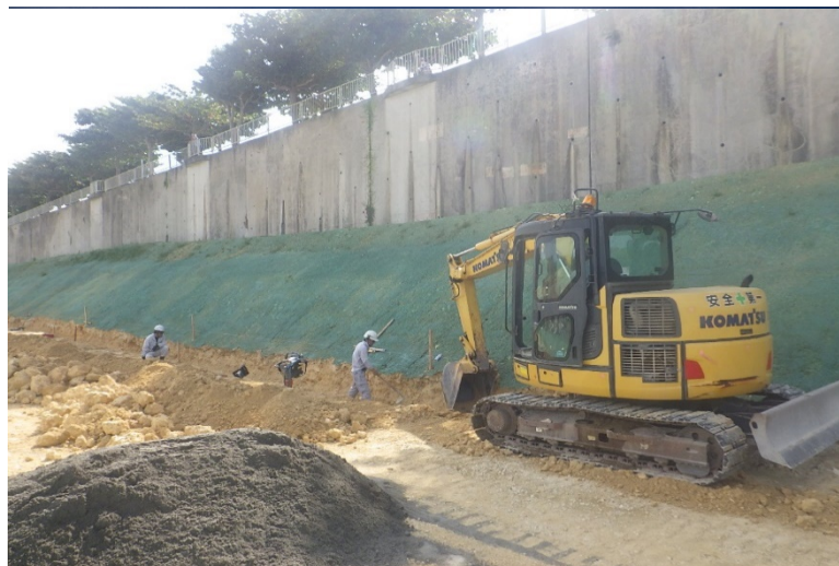
写真⑤ (小段排水床掘状況)