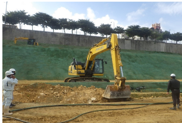
写真⑥ (工事車両入口整備状況)