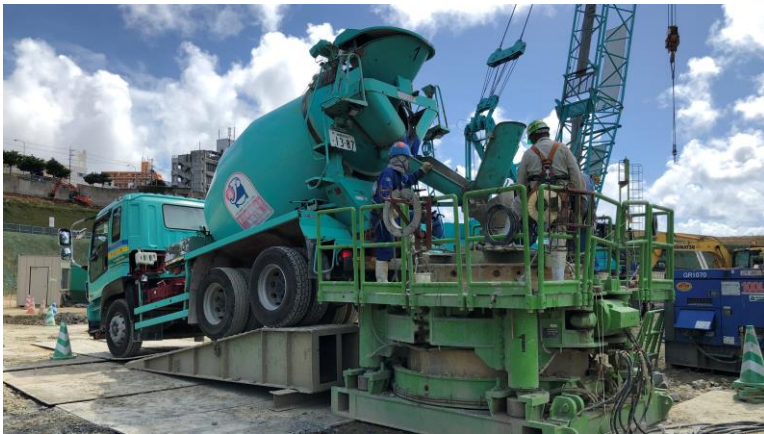
写真⑪(杭工事 コンクリート打設状況)