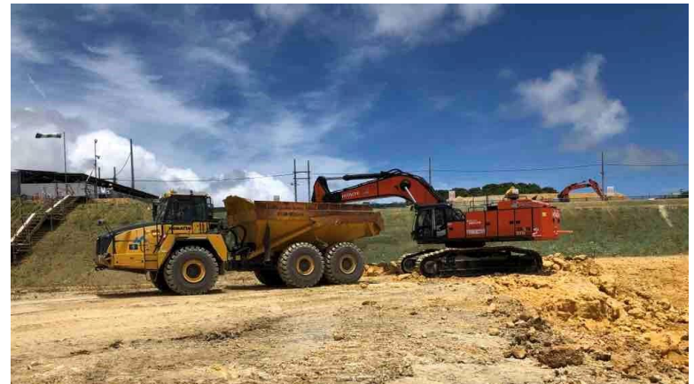
写真⑫ (土工事 掘削土積み込み状況)