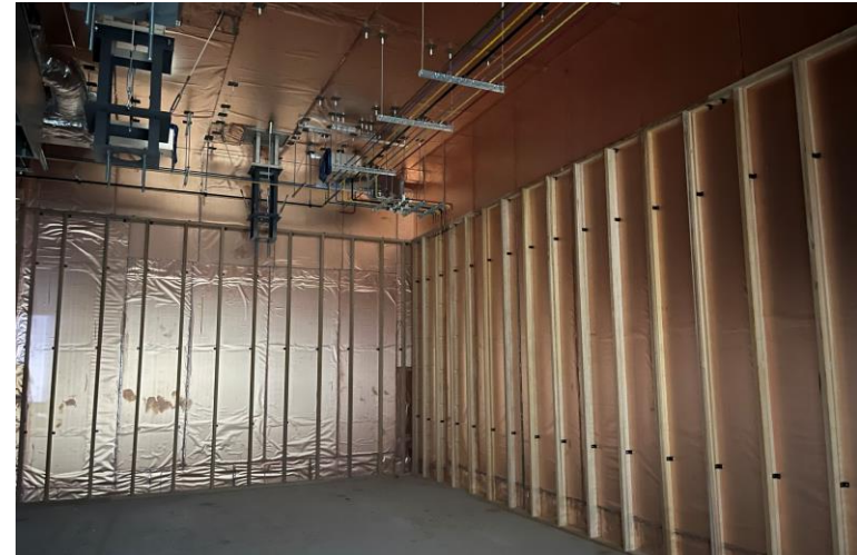
写真⑫ (内装工事 5階仕上施工状況)