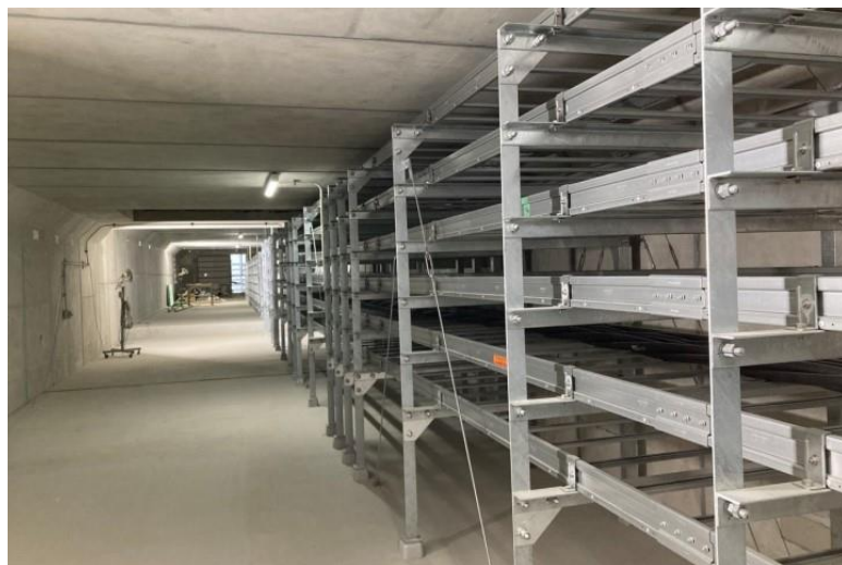
写真⑮(電気工事 ケーブルラック布設状況 (共同溝) )