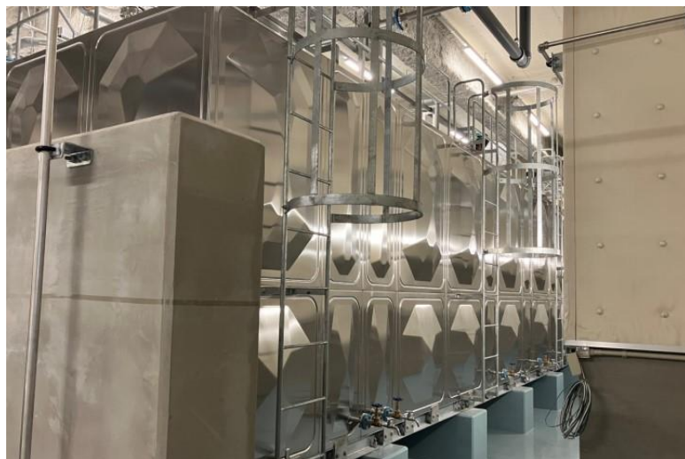
写真⑬(機械工事 1階RI排水処理室施工状況)