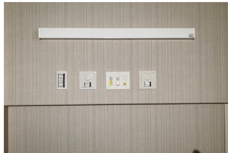
写真⑯(電気工事 ベッド灯・ナースコール・スイッチ取付状況)