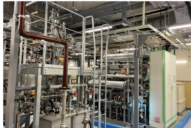
写真⑭(機械工事 1階感染排水処理室 施工状況)