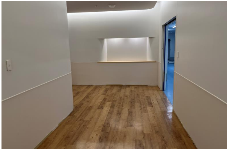
写真⑪(内装工事 1階仕上施工状況)