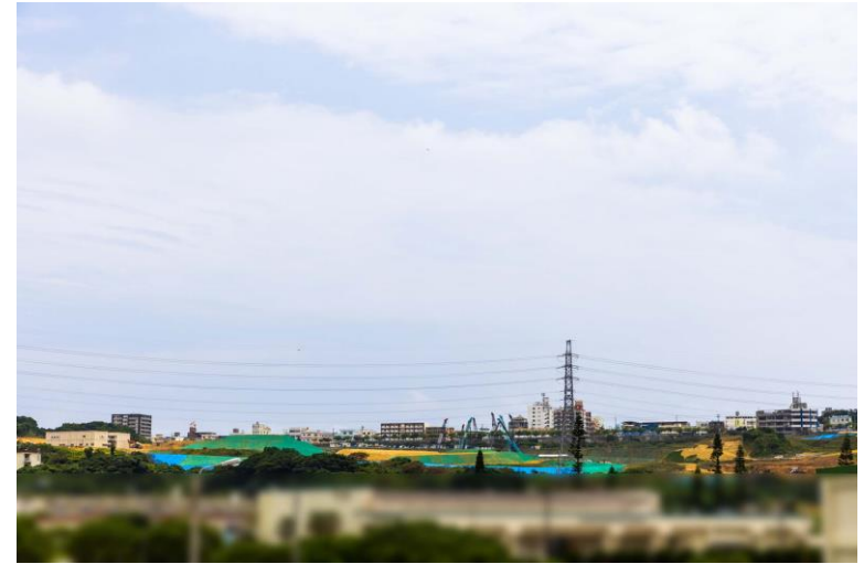
写真⑧(国道58号線より)