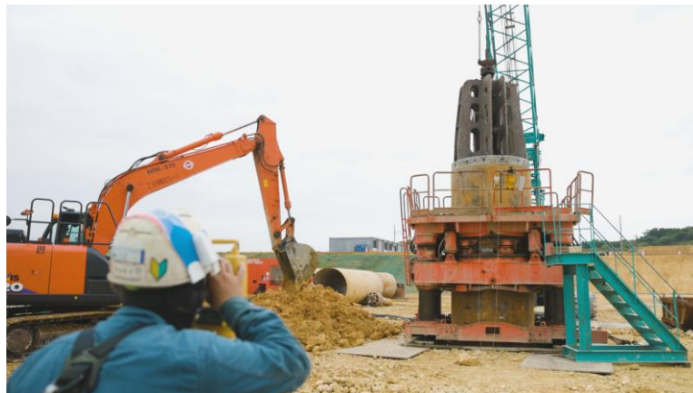
写真⑪(杭工事 掘削の様子)