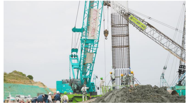
写真⑫ (杭工事 鉄筋かご建て込みの様子)