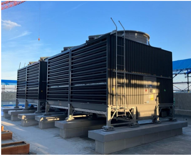
写真⑬(機械工事 14階屋上 冷却塔設置状況)