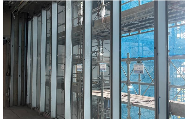
写真⑫ (建具工事 カーテンウォール施工状況)