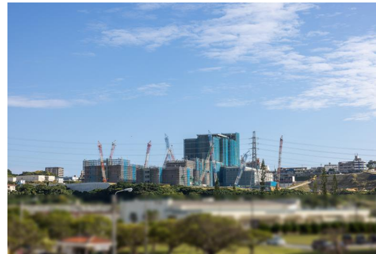
写真⑧(国道58号線より)