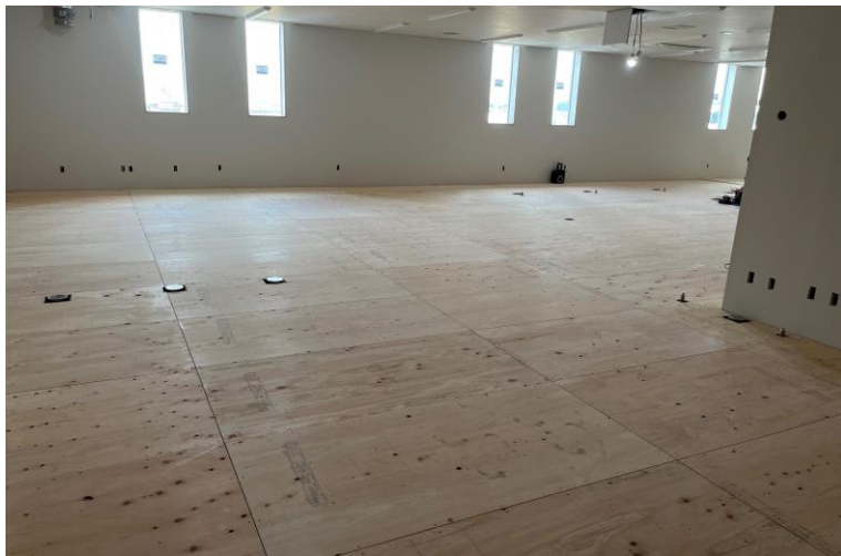
写真⑪(内装工事 3階乾式二重床工事施工状況)