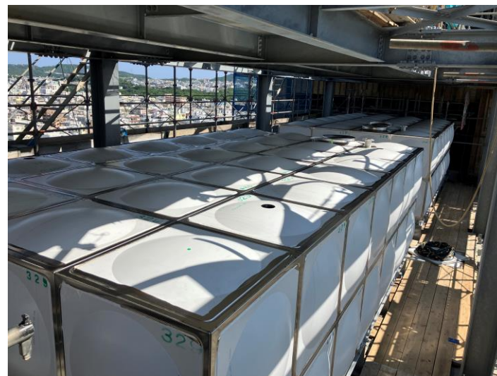
写真⑭(機械工事 R階 高架水槽組立状況)