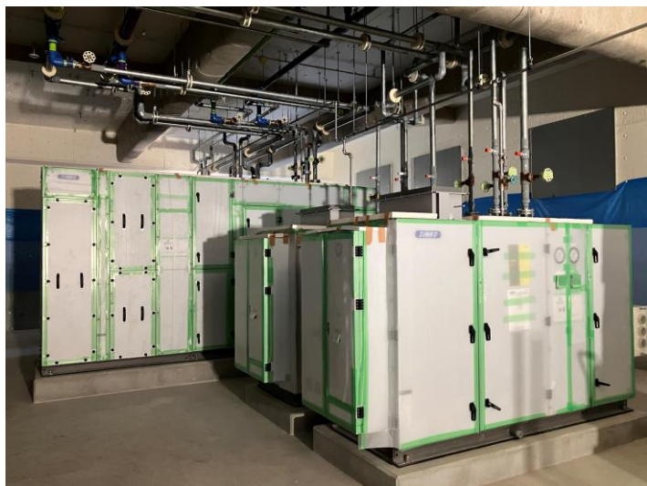
写真⑬(機械工事 6階機械室 配管吊込状況)