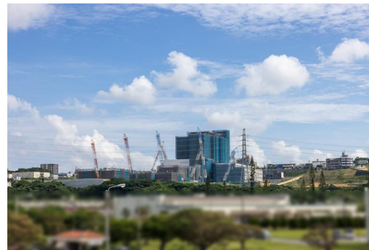
写真⑧(国道58号線より)