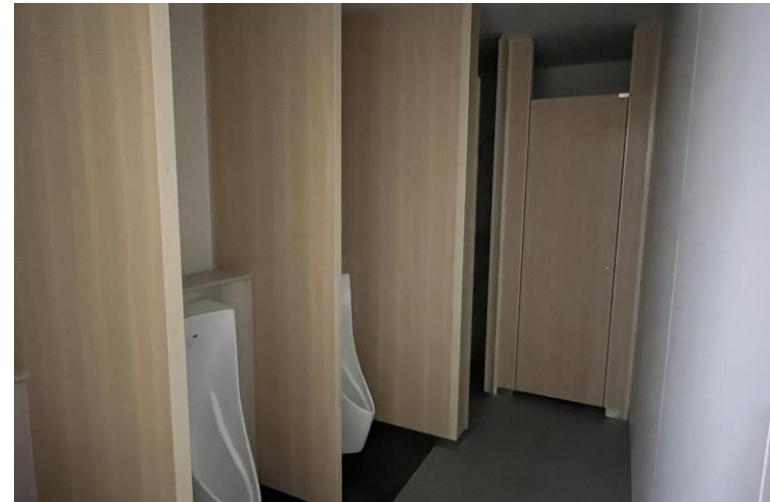
写真⑫ (内装工事 1階トイレ施工状況)