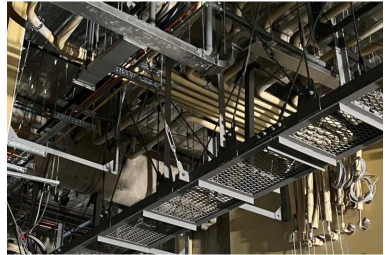
写真⑫ (5階手術室 天井内キャットウォーク設置状況)