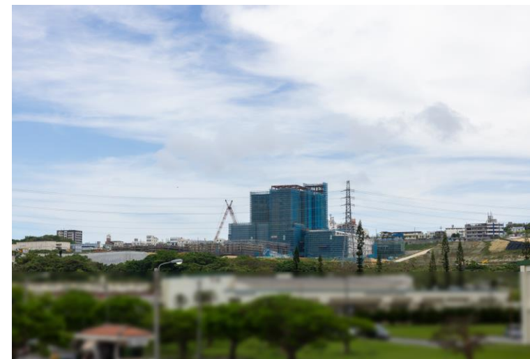
写真⑧(国道58号線より)