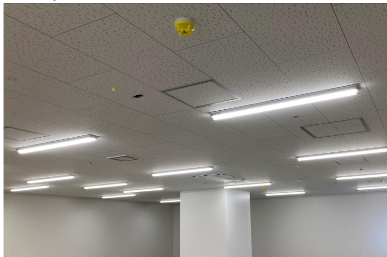
写真⑮(電気工事 1階 SPD倉庫 点灯確認)