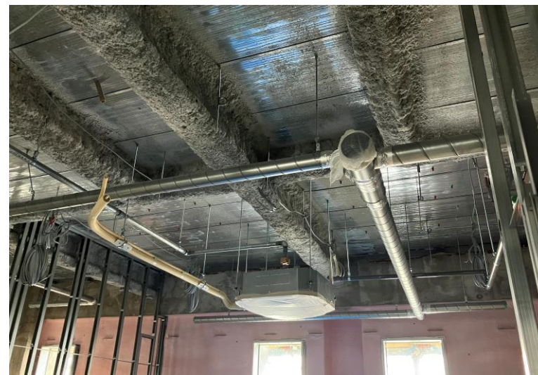
写真⑭(機械工事 8階 病室 先行吊込状況)