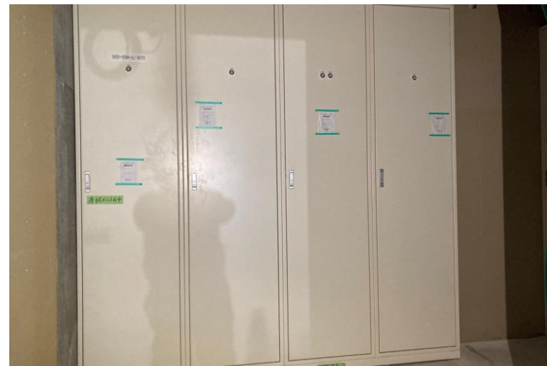
写真⑯(電気工事 3階 EPS 電灯盤設置状況)