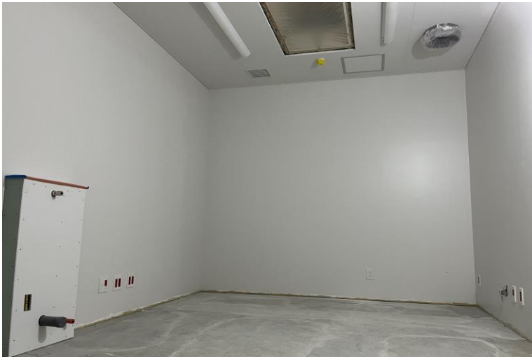
写真⑪(内装工事 1階仕上工事施工状況)