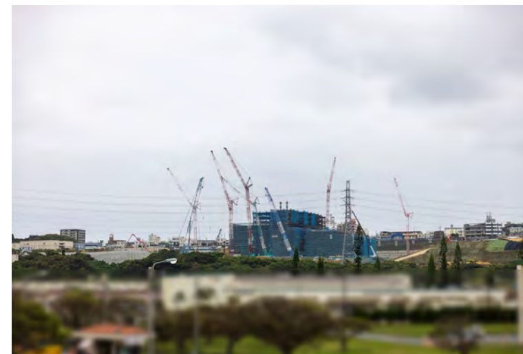
写真⑧(国道58号線より)