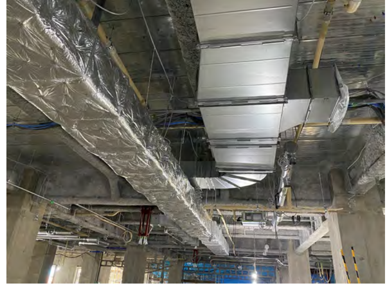
写真⑭(機械工事 3階天井内施工状況)