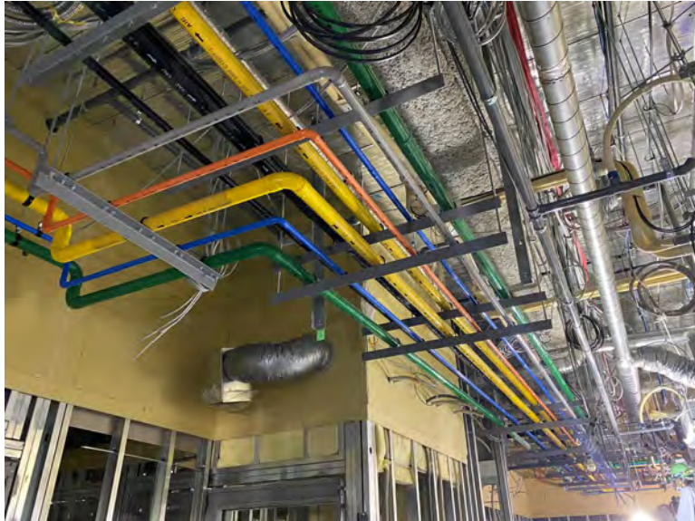
写真⑬(機械工事 1階天井内施工状況)