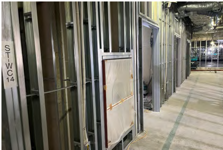
写真⑪(建具工事 1階鋼製建具施工状況)