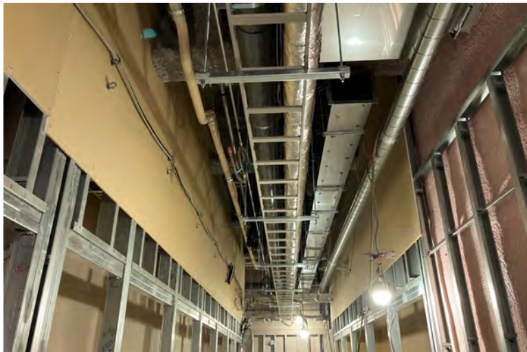
写真⑮(電気工事 1階ケーブルラック敷設状況)