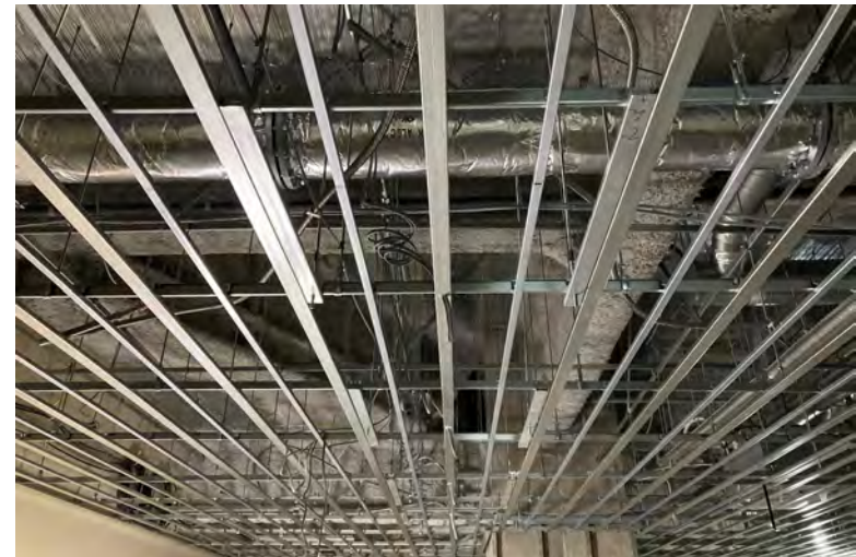
写真⑯(電気工事 1階照明器具支持材取付状況)