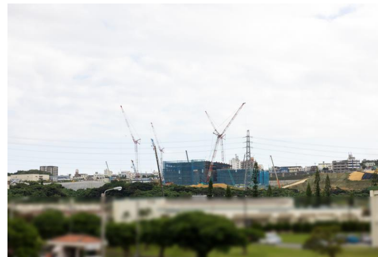
写真⑧(国道58号線より)