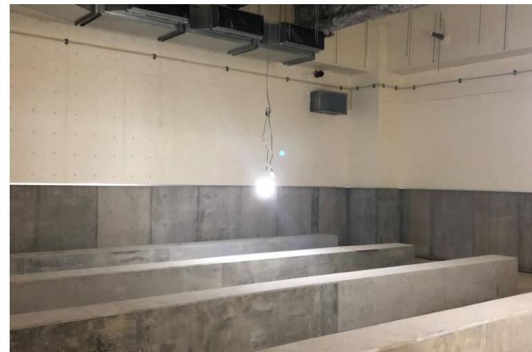
写真⑫(内装工事 1階ガラスウールマット施工状況)