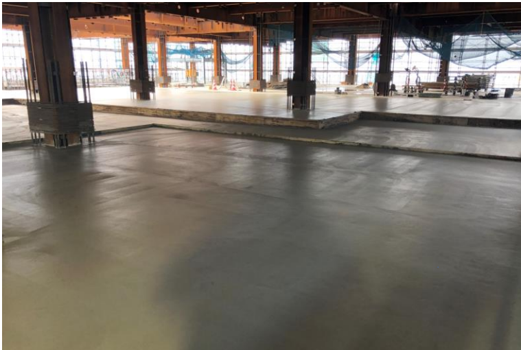
写真⑪(コンクリート工事 4階床コンクリート打設状況)