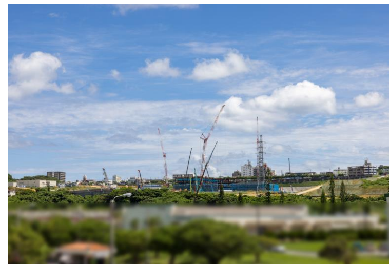
写真⑧(国道58号線より)