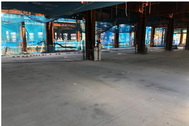
写真⑪(コンクリート工事 2階コンクリート施工状況)