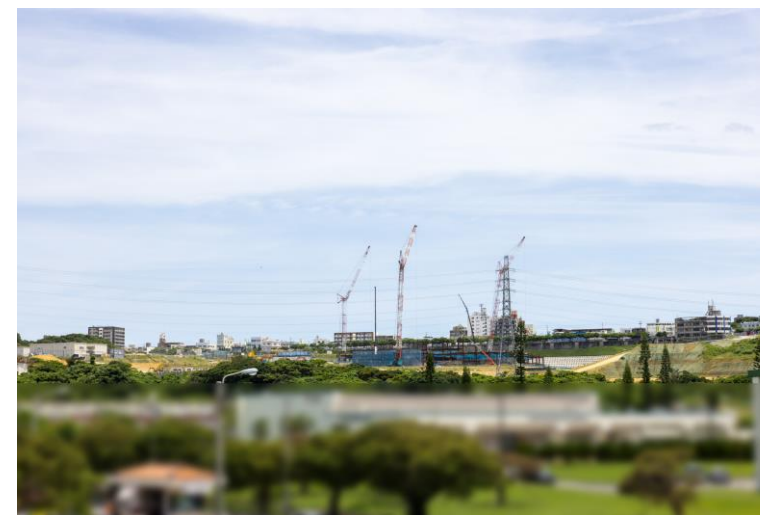
写真⑧(国道58号線より)