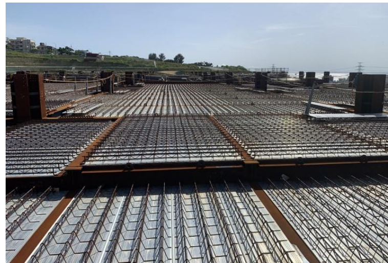
写真⑫ (型枠工事 3階床施工状況)