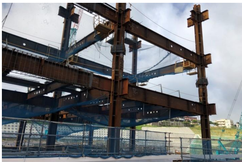
写真⑪(鉄骨工事 鉄骨建て方状況)