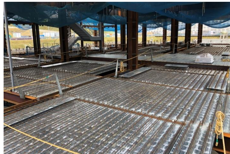
写真⑫(型枠工事 2階デッキスラブ施工状況)