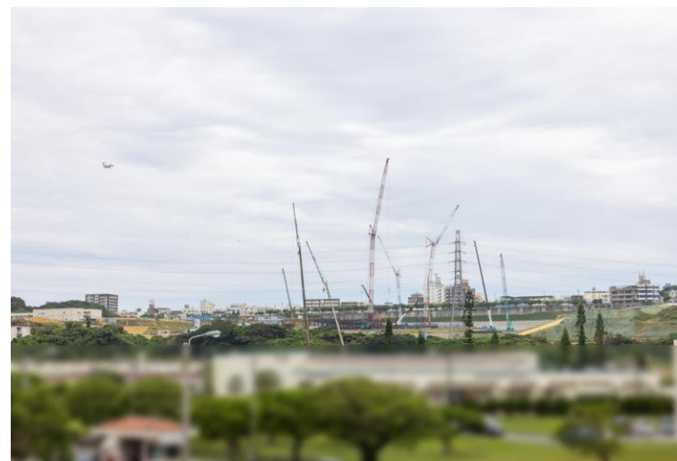
写真⑧(国道58号線より)