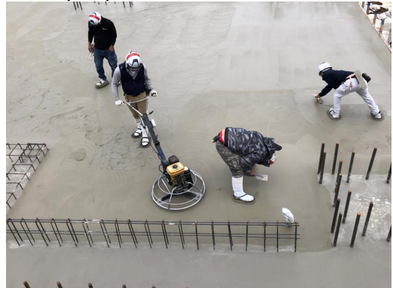
写真⑫(コンクリート工事 免震層底盤コンクリート打設状況)