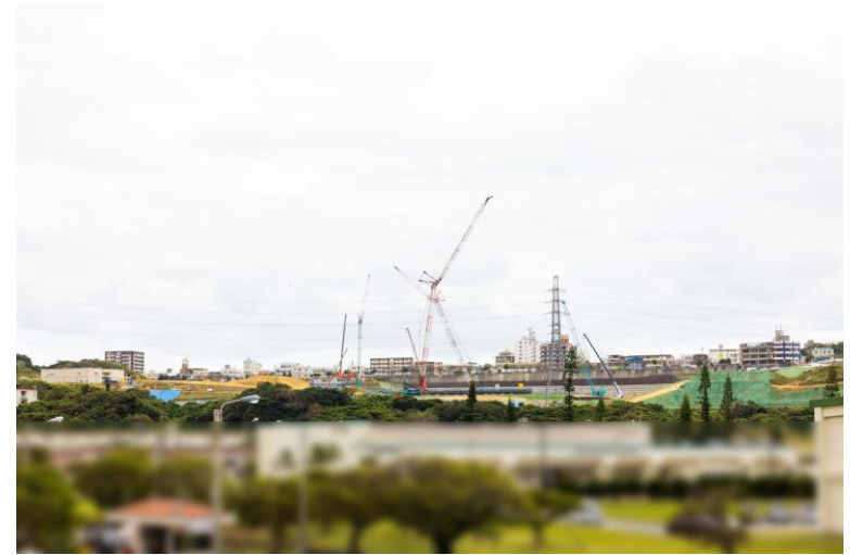
写真⑧(国道58号線より)