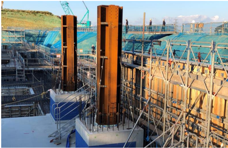
写真⑬(鉄骨工事 0柱施工状況)