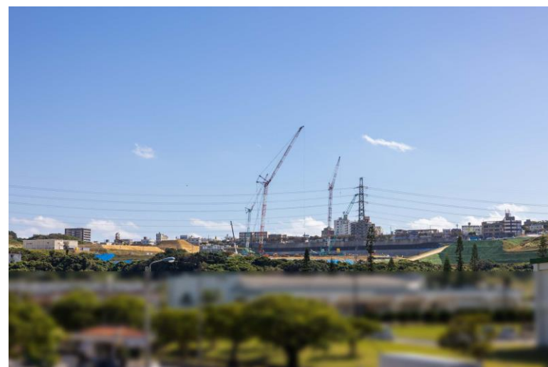
写真⑧(国道58号線より)