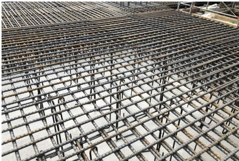
写真⑪(鉄筋工事 耐圧盤配筋状況)