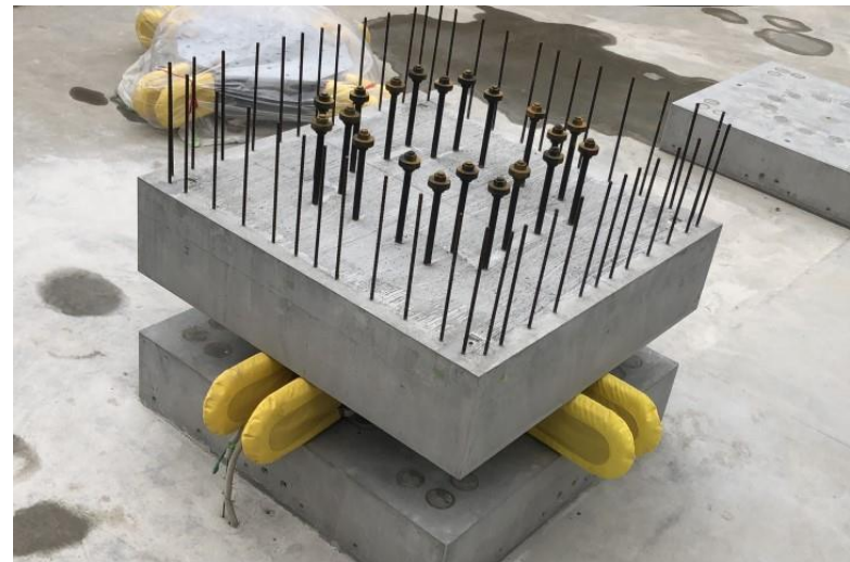
写真⑫ (P C工事 免震装置、基礎PC取付状況)