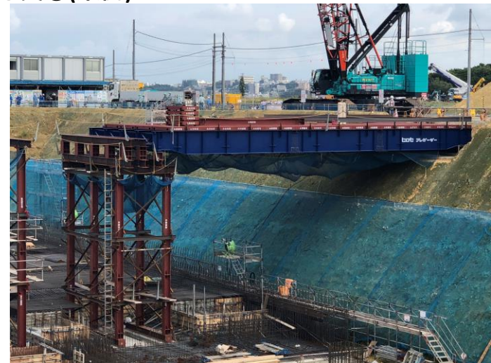
写真⑫ (仮設工事 置構台組立状況)