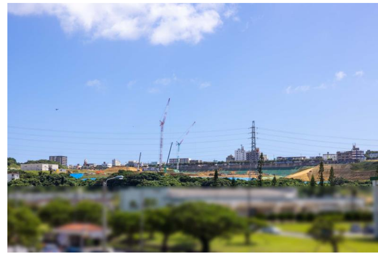
写真⑧(国道58号線より)