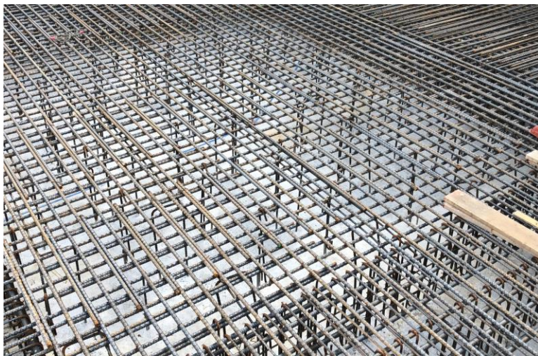
写真⑪(鉄筋工事 免震階床配筋状況)