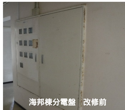
海邦棟分電盤 改修前