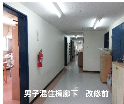
男子混住棟廊下 改修前