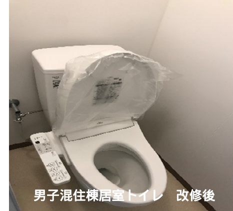
男子混住棟居室トイレ 改修後