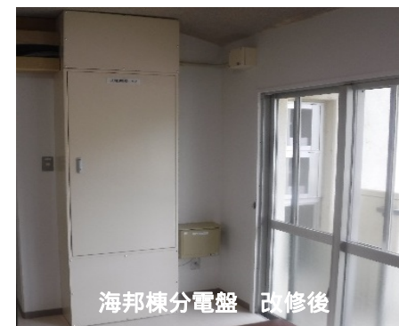
海邦棟分電盤 改修後