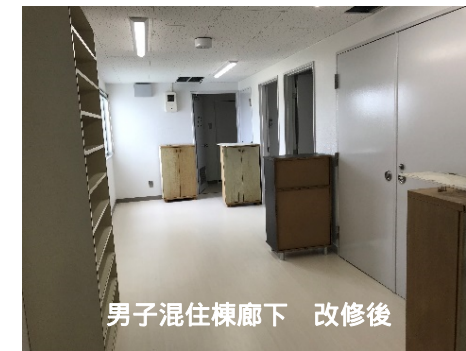
男子混住棟廊下 改修後