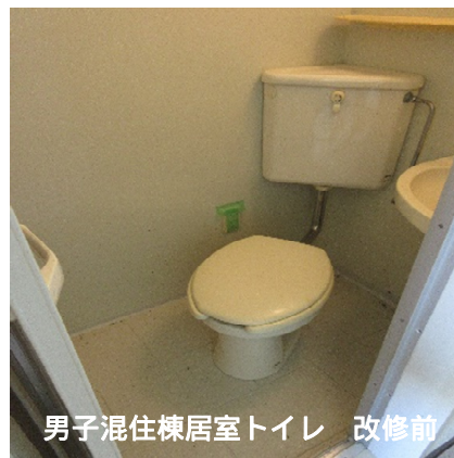
男子混住棟居室トイレ 改修前