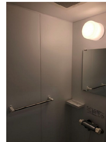
シャワー室(A・Cブロック)