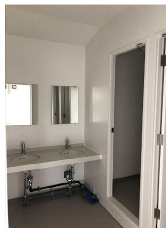
シャワー室(A・Cブロック)