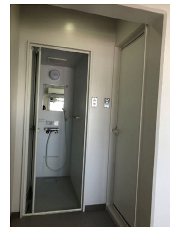
ユニットシャワー、トイレ(Bブロック)