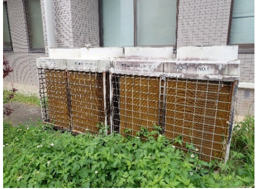
改修前 室外機（経年25年）