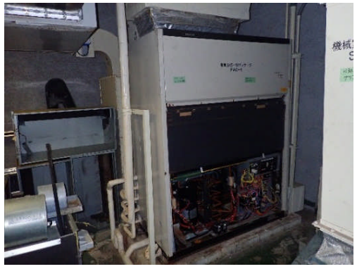
改修前 室内機（経年25年）