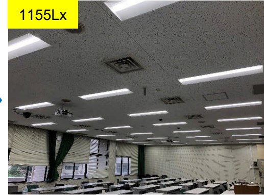
1155Lx 講義室 (改修後)