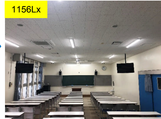
1156Lx 大講義室 LED器具 (改修後)