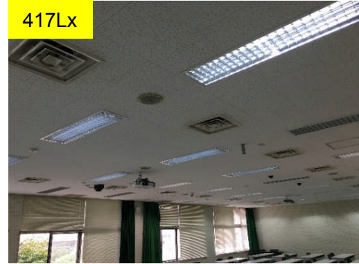
417Lx 講義室 (改修前)