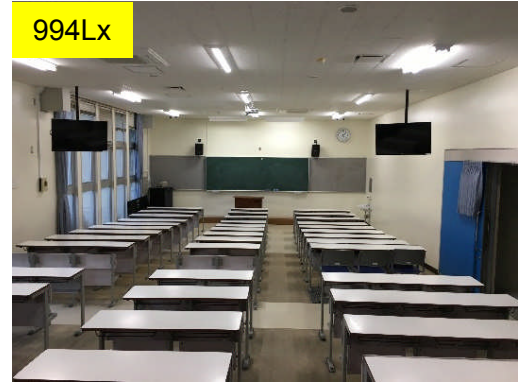
994Lx 大講義室 蛍光灯 (改修前)