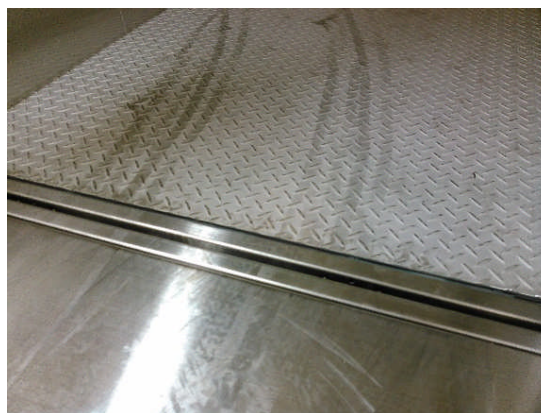
床 自動レベル調整