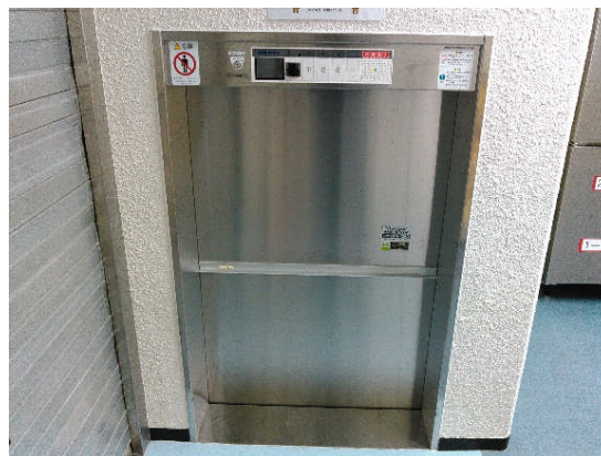
乗り場戸（開閉センサー付）