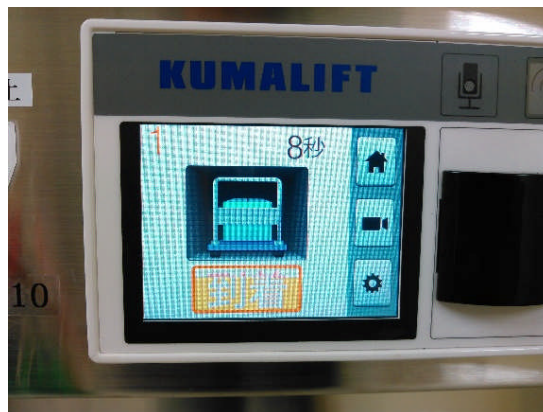
操作盤 待機時間表示