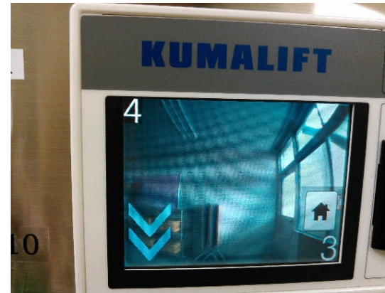
操作盤 インターホン