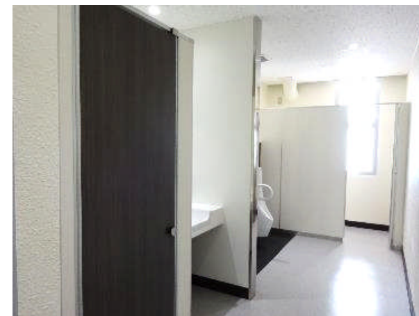
▲ 附属中学校トイレ〔改修後〕