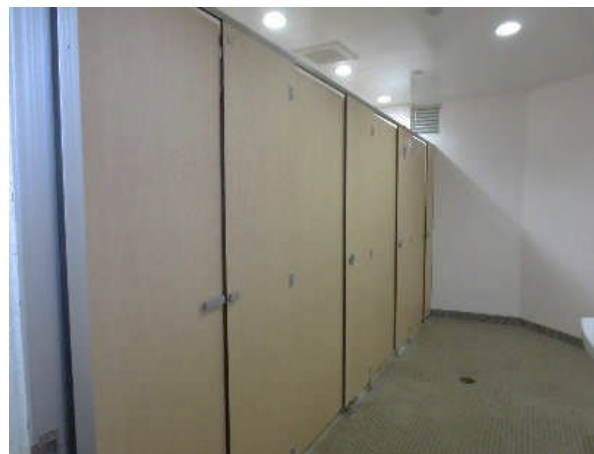
▲ 附属中学校トイレ〔改修前〕