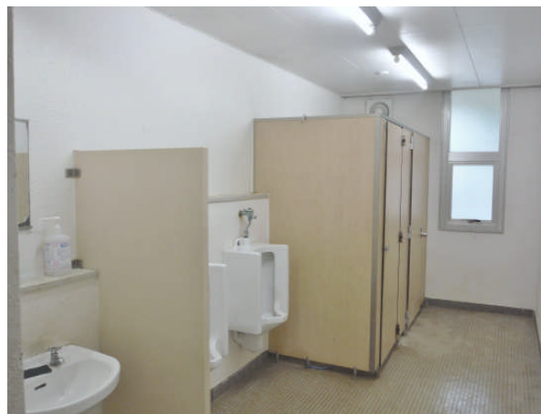
▲ 附属中学校トイレ〔改修前〕