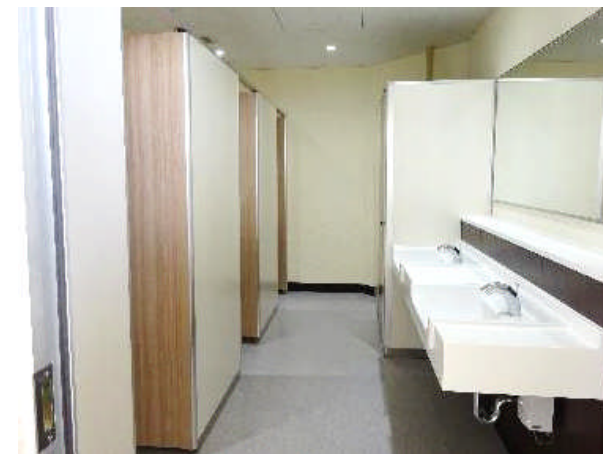
▲ 附属中学校トイレ〔改修後〕