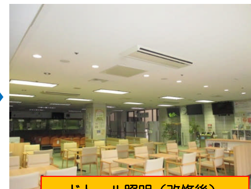
ドトール照明(改修後)