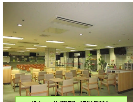
ドトール照明(改修前)

■ 成果：テーブル照度が 130Lx→320Lx (246%アップ) 廊下照度が 50Lx→140Lx (280%アップ)