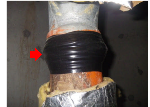
忍者テープ（応急処置）