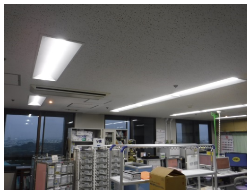
ナースステーション LED照明

附属病院ナースステーションの設置後31年が経過した蛍光灯をLEDへ更新することで、 照度アップ 及び 電力料金の削減 を行った。