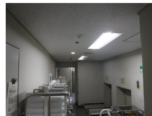
搬送室 LED照明 (人感センサー付)