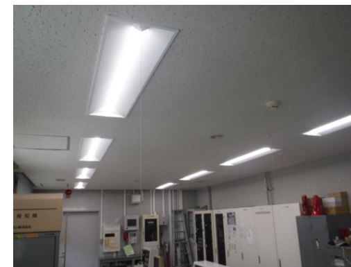
守衛室・防災センターLED照明 (プルスイッチ付)