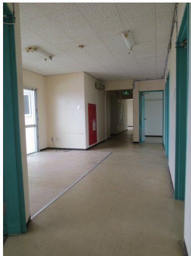
リビング改修前写真