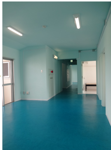
リビング改修後写真