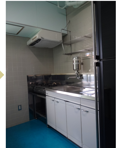
補食室改修後写真