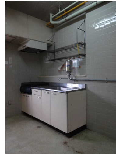
補食室改修前写真