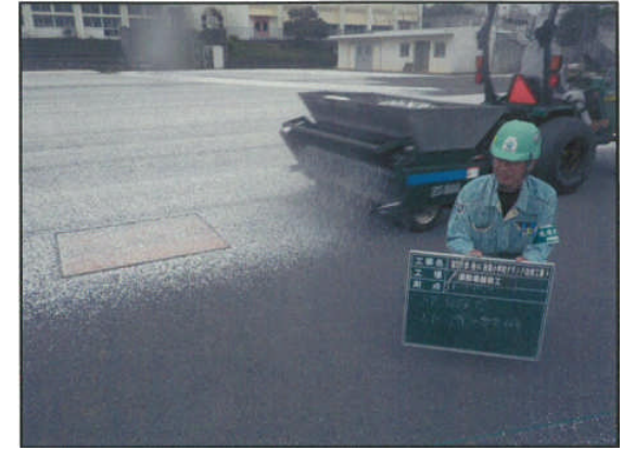
⑤改修中(化粧砂、苦汁施工)