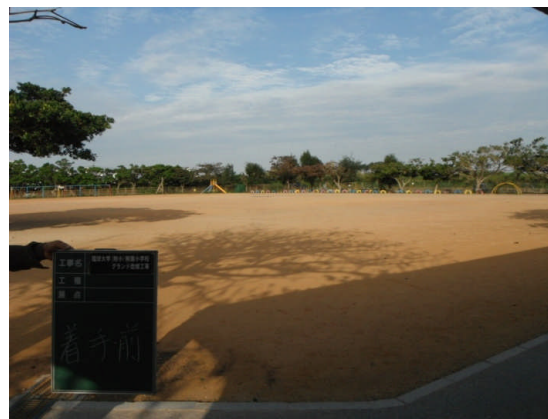
①改修前(附小グランド)