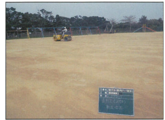
④改修中(2層目敷均し、転圧)