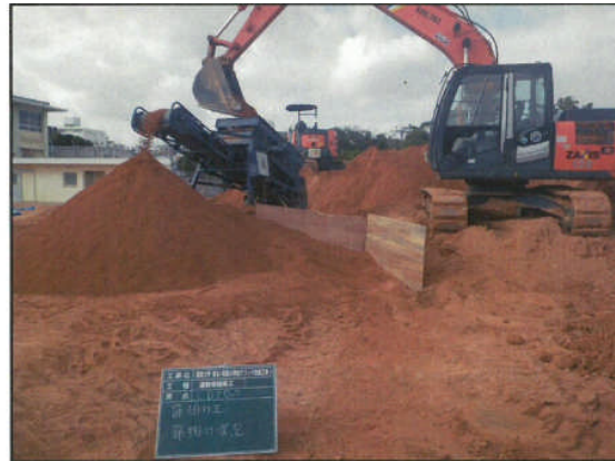
②改修中(表土掘削のふるい土)