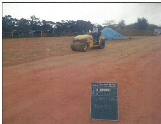
③改修中(1層目敷均し、締固め)