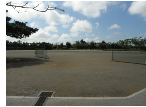
⑥改修後(附小グランド)