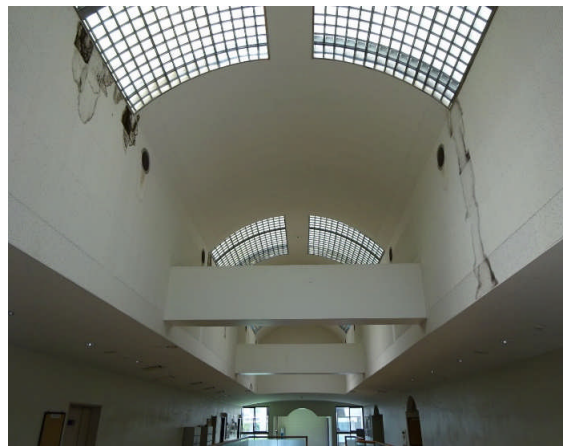
トップライト(改修前)