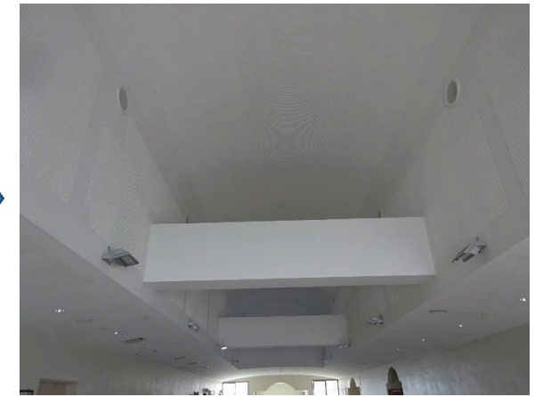
トップライト(改修後)