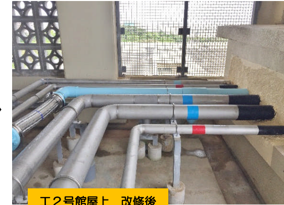
工2号館屋上 改修後