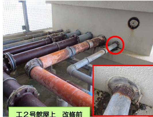
工2号館屋上 改修前