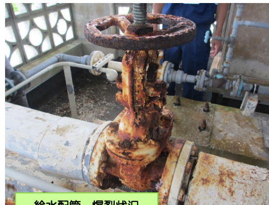
給水配管 爆裂状況