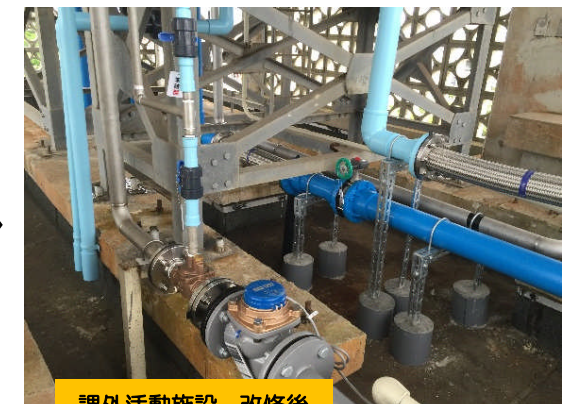
課外活動施設 改修後