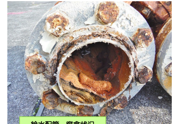
給水配管 腐食状況